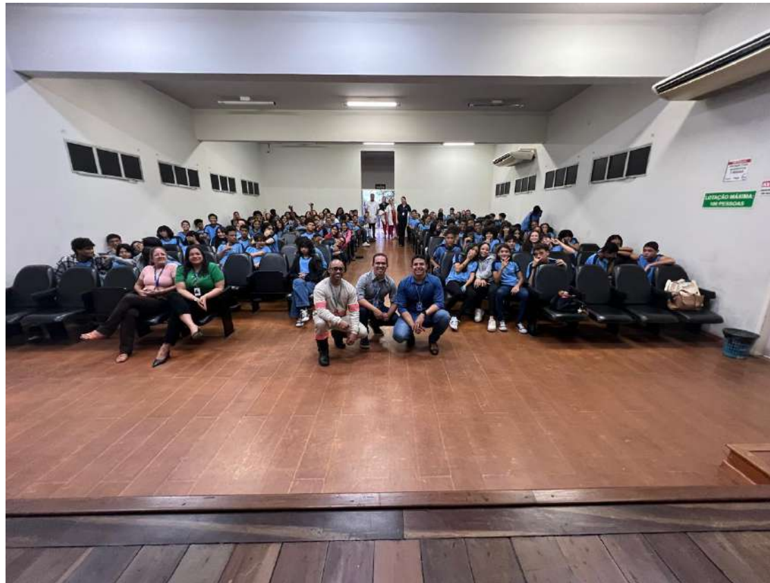
SESI Roberto Simonsen

No mês de abril com a temática: Abril verde – Trabalho Seguro . As nossas iniciativas para promover a saúde, segurança e responsabilidade social contou com Ações educativas, momentos interativos oportunizando também os alunos da REDE SESI DE EDUCAÇÃO. Para tais realizações contamos com a parceria da ENERGISA/S/A, que levou aos alunos a palestra educativa: Comunidade Segura: Cuidados com a rede elétrica . Em três Unidades SESI, 830 alunos na faixa etária de 06 a 16 anos foram contemplados com palestras e material educativo sobre o tema.