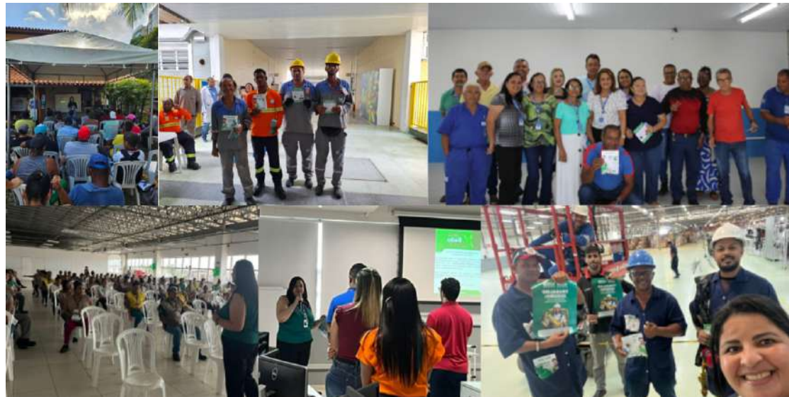
Na rede SESI de Educação

Destaque para as empresas que prezaram por orientar maior número possível de seus de colaboradores como: 3D ENGENHARIA; ALTENBURG; COMPANHIA DE DESENVOLVIMENTO REGIONAL DE SERGIPE – CODERSE; DUAS RODAS; FABISE; INDUSTRIA ORIENTAL; INTERGRIFFES; JCA PLÁSTICOS; LEITE DE ROSAS; PETRÓLEO BRASILEIRO; PROJETEL; REDE CONECTA; SERGIPE GÁS; UNIÃO ENGENHARIA; USINA SÃO JOSÉ DO PINHEIRO; VINATON TECNOLOGIA & ENGENHARIA LTDA E VOTORANTIM.