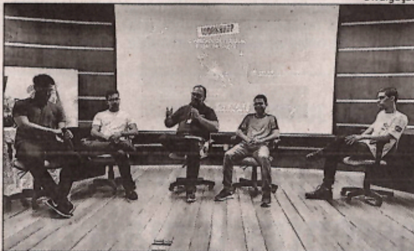
SENAI de Sergipe realiza Workshop sobre o mercado de trabalho