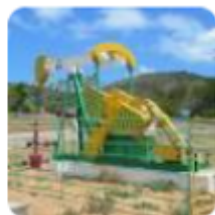
Foto: ilustrativa. Análise do Núcleo de Informações Econômicas da FIES revela aumento nos repasses e destaca São Cristóvão como município com maior...

Link: https://93noticias.com.br/noticia/102508/sergipe-recebe-r-5-1-milhoes-em-royalties-de-petroleo-e-gas-em-dezembro-com-alta-de-1-2-em-relacao-a-janeiro