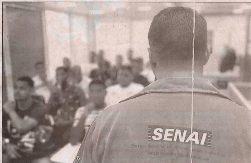
EM 2023, o programa Qualifica Mais registrou um recorde ao capacitar 300 alunos em diversas áreas de atuação

Segundo Juca, cada curso oferecido pela gestão municipal tem o propósito de atender às reais necessidades de toda a região