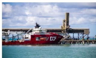
Os principais destinos dos produtos exportados pelo estado foram: Japão, Austrália e Países Baixos/Holanda.

Análise realizada pelo Centro Internacional de Negócios – CIN/SE, da Federação das Indústrias do Estado de Sergipe (FIES), com base nos dados do Comex Stat, sistema para consultas e extração de dados do comércio exterior brasileiro, disponibilizado pelo Ministério da Economia, apontou que as exportações sergipanas, em janeiro deste ano, somaram aproximadamente US$ 6,6 milhões.