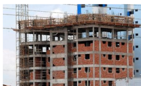
Índice da Construção Civil registra alta de 18,65% em 2021

O Sistema Nacional de Pesquisa de Custos e Índices da Construção Civil (Sinapi) registrou uma alta de 18,65% em 2021. O resultado foi divulgado hoje (11) pelo Instituto Brasileiro de Geografia e Estatística (IBGE). Em comparação a 2020, o índice subiu 8,49 pontos. É a maior taxa anual desde 2013.