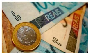
Mercado financeiro eleva projeção da inflação para 8,69%

Análise realizada pelo Núcleo de Informações Econômicas da Federação das Indústrias do Estado de Sergipe (FIES), com base nos dados do Instituto Brasileiro de Geografia e Estatística (IBGE), revelou que, em janeiro deste ano, a capital sergipana teve inflação de 0,90%, medida pelo Índice de Preços ao Consumidor Amplo – IPCA.