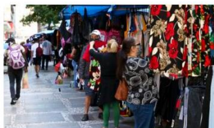
No comparativo com dezembro de 2020, as vendas do comércio restrito assinalaram queda de 11,1%

Análise realizada pelo Núcleo de Informações Econômicas da Federação das Indústrias do Estado de Sergipe (FIES), com base nos dados da Pesquisa Mensal do Comércio (PMC) do IBGE, apontou que as vendas do comércio varejista ampliado sergipano, em dezembro de 2021, assinalaram redução de 3,0%, em relação ao mês imediatamente anterior (novembro/2021), na série com ajuste sazonal (método que uniformiza os períodos de comparação). No comparativo com dezembro de 2020, observou-se decréscimo de 8,5% e no acumulado de 2021 o crescimento registrado foi de 6,1%, em relação ao ano de 2020