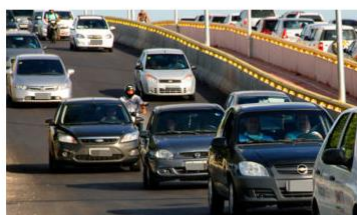
As vendas de veículos novos no estado, no primeiro mês do ano, totalizaram 833 unidades.

Análise realizada pelo Núcleo de Informações Econômicas (NIE) da Federação das Indústrias do Estado de Sergipe (FIES), com base nos dados da Federação Nacional da Distribuição de Veículos Automotores (FENABRAVE), apontou que as vendas de veículos novos no estado, no primeiro mês do ano, totalizaram 833 unidades.