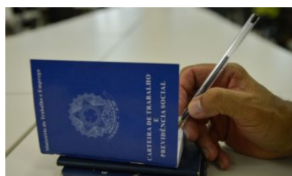
Em Sergipe, a taxa de desocupação passou de 17,0% no 3º trimestre para 14,5%, no último trimestre de 2021.