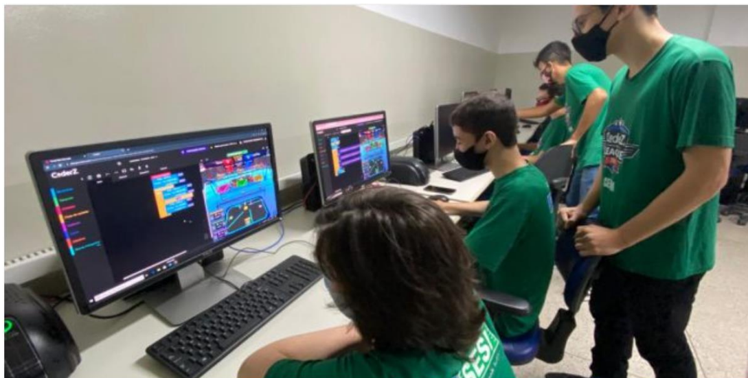
Alunos do Sesi em aula