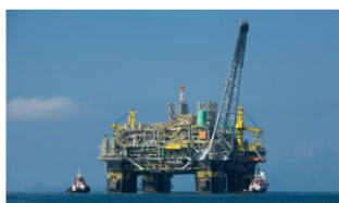
Segundo a ANP houve redução de 4,1% na produção de petróleo em relação ao mês anterior e de 10,9% comparativamente a novembro de 2019.

Análise realizada pelo Núcleo de Informações Econômicas da Federação das Indústrias do Estado de Sergipe (FIES), com base nos dados da Agência Nacional do Petróleo, Gás Natural e Biocombustíveis (ANP), revelou que a produção de petróleo no estado, em dezembro de 2021, alcançou, em média, 7,5 mil barris por dia (bpd), registrando redução de 3,0% em relação à produção do mês anterior (novembro/2021).