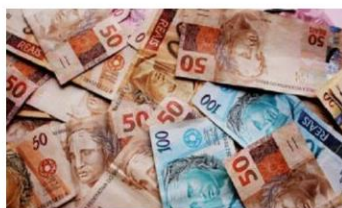
O repasse assinalou um crescimento real de 1,0%, considerando o efeito da inflação.

Análise realizada pelo Núcleo de Informações Econômicas da Federação das Indústrias do Estado de Sergipe (FIES), com base nos dados da Secretaria do Tesouro Nacional (STN), indicou que o repasse do Fundo de Participação dos Estados (FPE) para Sergipe, em janeiro do ano corrente, foi de R$ 413,7 milhões.