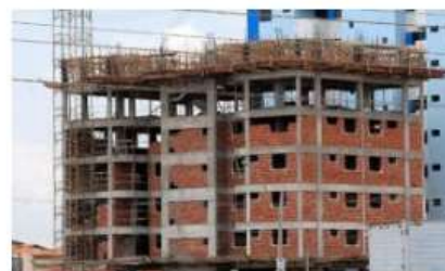
o valor do custo médio por metro quadrado, no mês analisado, ficou em R$ 992,96

Análise realizada pelo Boletim Sergipe Econômico, parceria do Núcleo de Informações Econômicas (NIE) da Federação das Indústrias do Estado de Sergipe (FIES) e do Departamento de Economia da UFS, com base nos dados do Sistema Nacional de Pesquisa de Custos e Índices da Construção Civil – SINAPI, uma produção conjunta do IBGE e da Caixa Econômica Federal, revelou que o custo médio da construção em Sergipe, por metro quadrado (m 2 ), em julho deste ano, registrou alta de 0,9%, quando comparado com o mês imediatamente anterior, junho último.